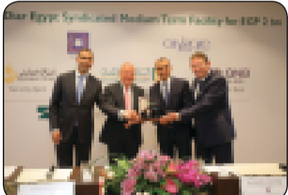
تم توقيع عقد التمويل في حضور الشيخ حمد بن

بنوك «الأهلي المصري، مصر وقطر الوطني الاهلي» يوقعون عقد تمويل مشترك بمبلغ ٢ مليار جنيه للمساهمة في تمويل مشروع شركة الديار القنطرة "سيتي جيت"