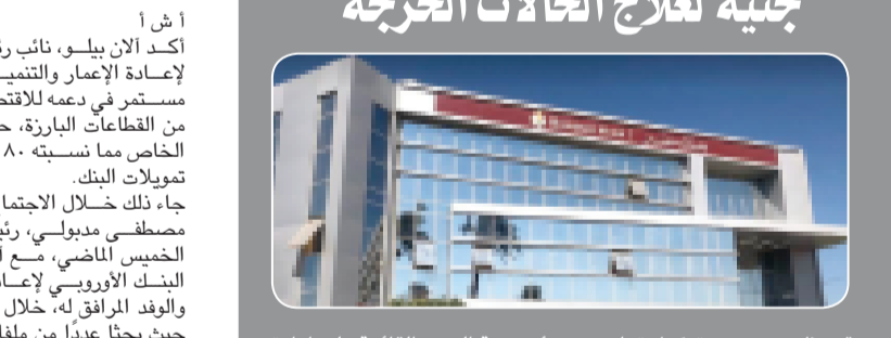
بنك مصر يستكمل دعمه لمستفي الناس للأطفال ويتبرع بـ١٠ مليون جنيه لعلاج الحالات الحرجة

وقع بنك مصر بروتوكول تعاون مع مؤسسة الجود القائمة على إدارة وتشغيل مستشفى الناس للأطفال، وذلك للتبرع بمبلغ ١٠ مليون جنيه للمساهمة في علاج الحالات الحرجة من الأطفال المرضى، والتقليل من قوائم الانتظار.