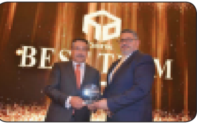
تم تسليم شهادات تقدير لوفدي القطاعين تقديراً

«التعمير والإسكان» يكرم قطاعي الشركات والقروض المشتركة والمشروعات الصغيرة والمتوسطة